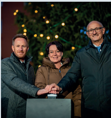
Feierliche Illuminierung des Obsteiger Christbaums am Landhausplatz mit Bürgermeister Erich Mirth, Präsidentin Sonja Ledl-Rossmann und LH Anton Mattle.