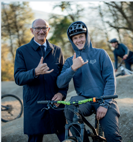
Versprechen gehalten: Wiedereröffnung des Pumptracks in Baumkirchen auf Initiative von LH Anton Mattle.