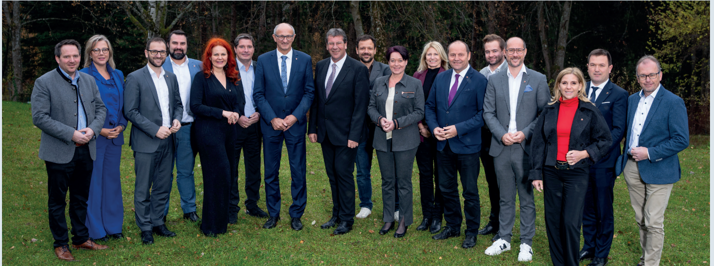
Der Landtagsklub der Tiroler Volkspartei hat sich am Grillhof auf den Budgetlandtag vorbereitet.