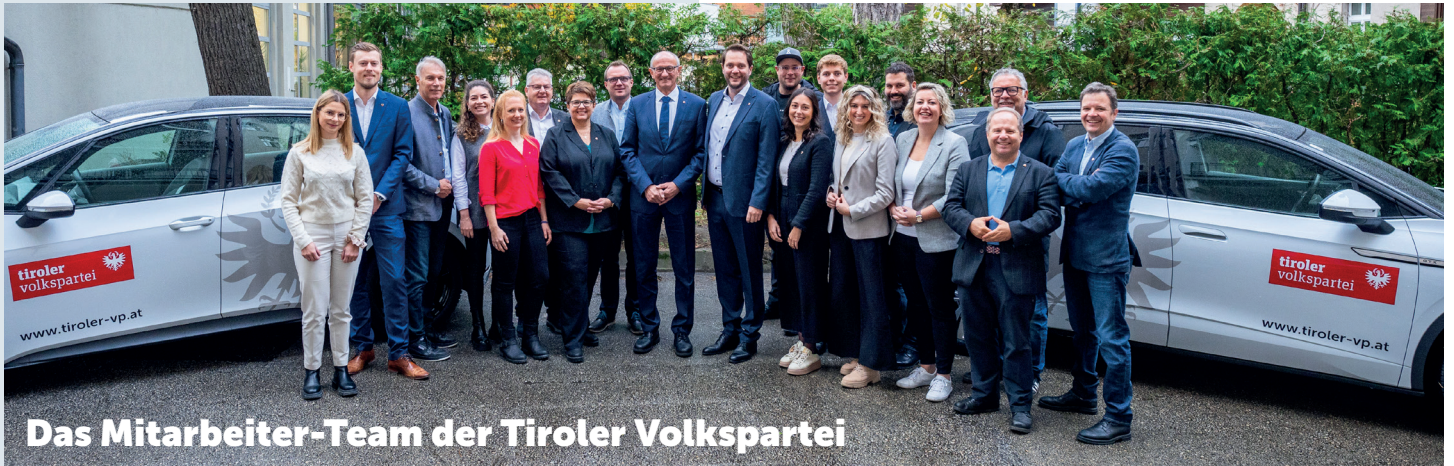
Das Mitarbeiter-Team der Tiroler Volkspartei